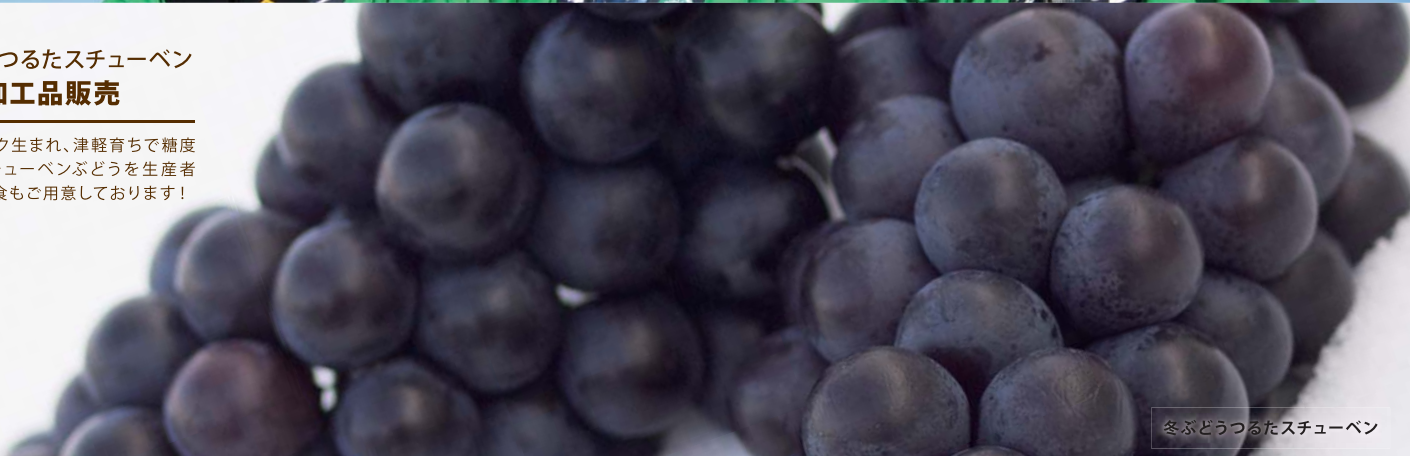
冬ぶどうつるたスチューベン

ニューヨーク生まれ、津軽育ちで糖度20度のスチューベンぶどうを生産者が直売。試食もご用意しております!